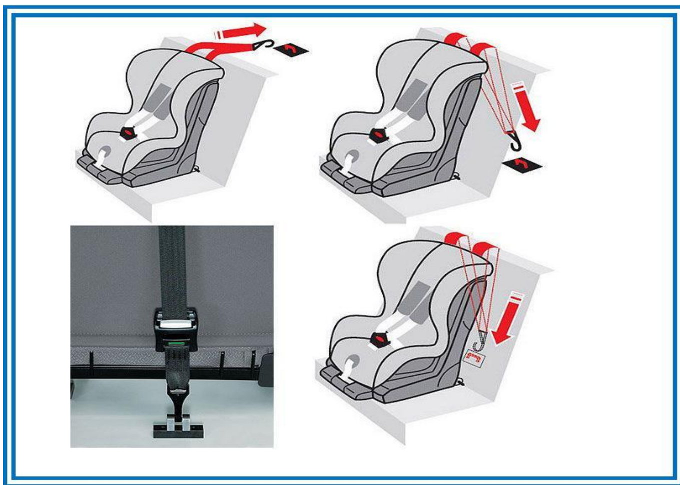
Рисунок 7. Способы фиксации якорного крепления

части спинки заднего дивана автомобиля. Как правило, место крепления «якоря» обозначено соответствующим рисунком (ребенок в автокресле с якорем, направленным назад).