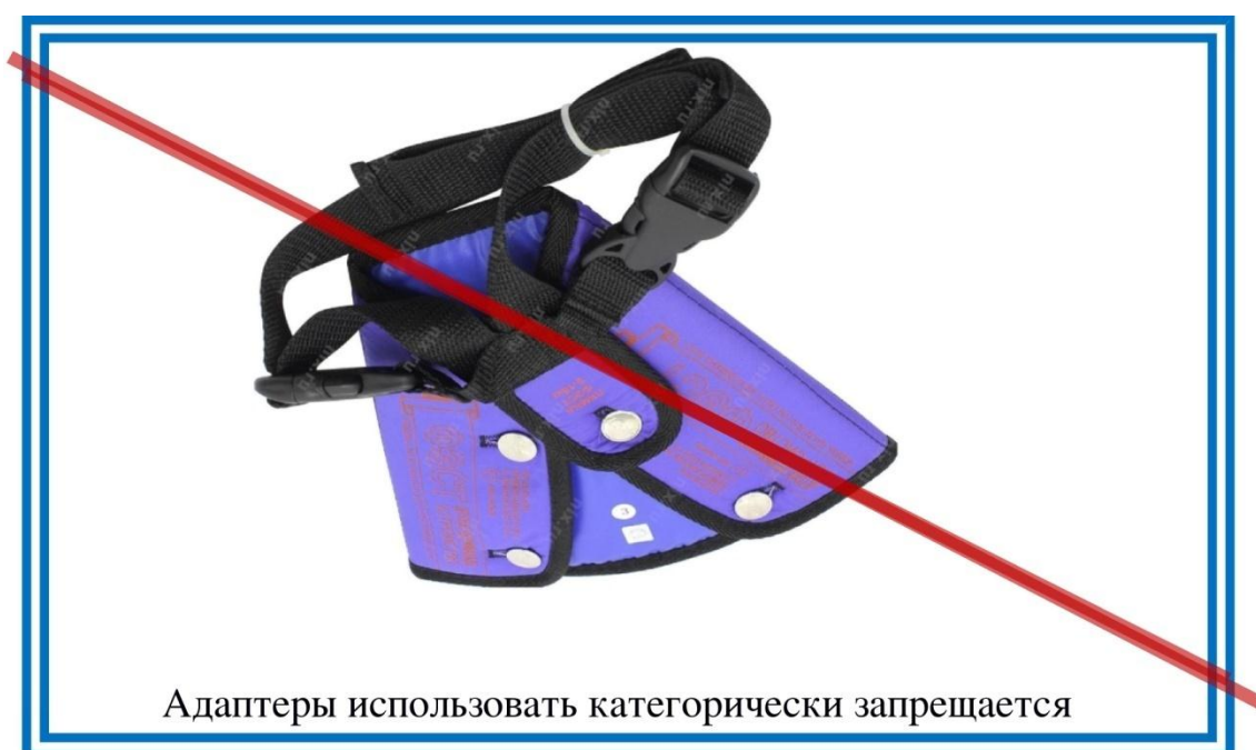
Рисунок 2. Внешний вид адаптера

Кроме представленных детских удерживающих устройств в магазинах еще продаются адаптеры как фирмы «ФЭСТ», так и других фирм. Госавтоинспекция выступает категорически против их применения, так как при ДТП адаптер оказывает слишком высокие нагрузки на брюшную полость ребенка, практически врезается в нее, что приводит к травмированию внутренних органов.