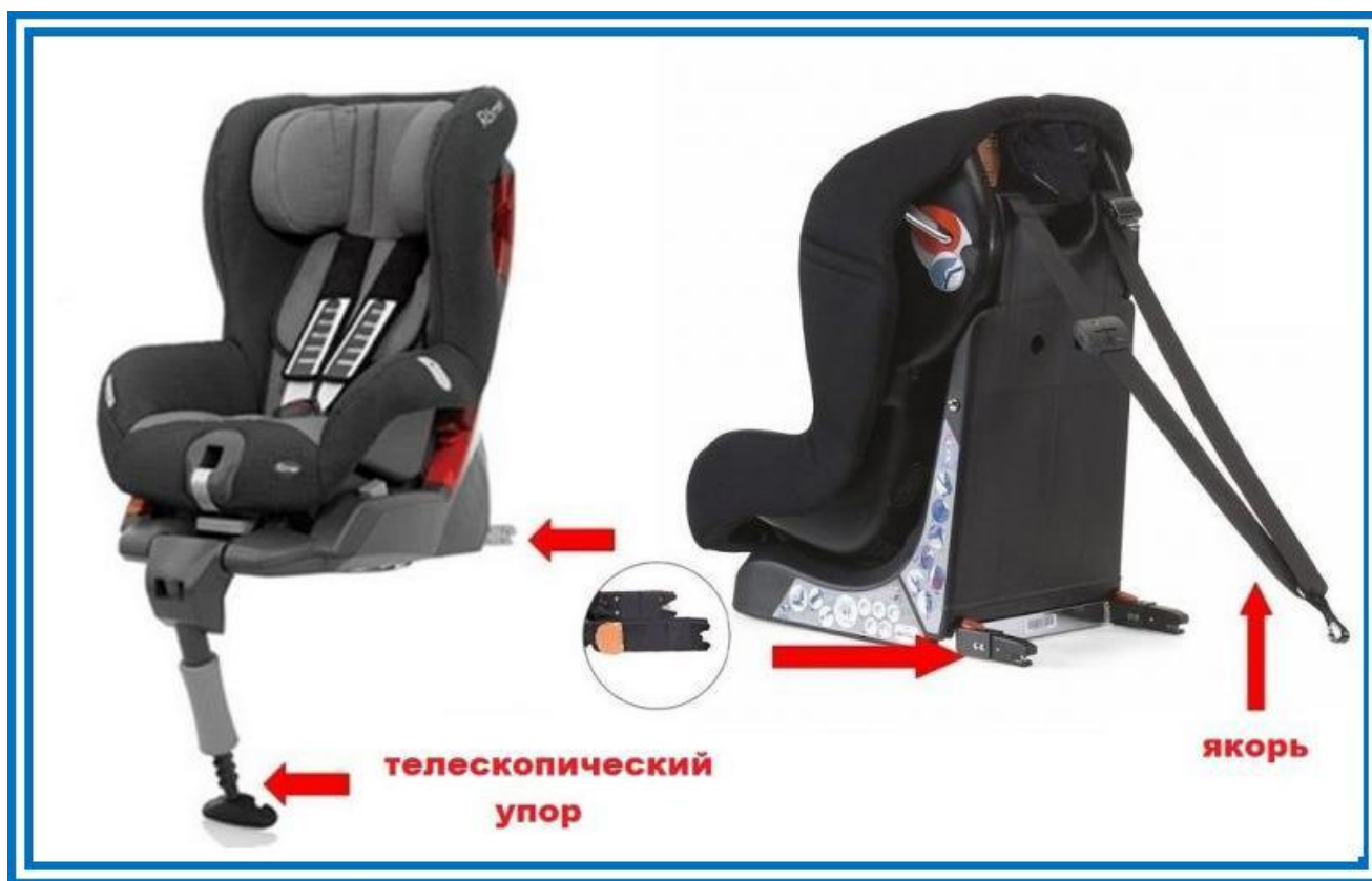
Рисунок 6. Телескопический упор и якорное крепление

Телескопический упор и якорное крепление разработаны специально для того, чтобы в момент столкновения снизить нагрузку на основное крепление детского автокресла, избежать возможности «клюющего» движения при лобовом столкновении и этим обеспечить более высокую безопасность в аварийных ситуациях.