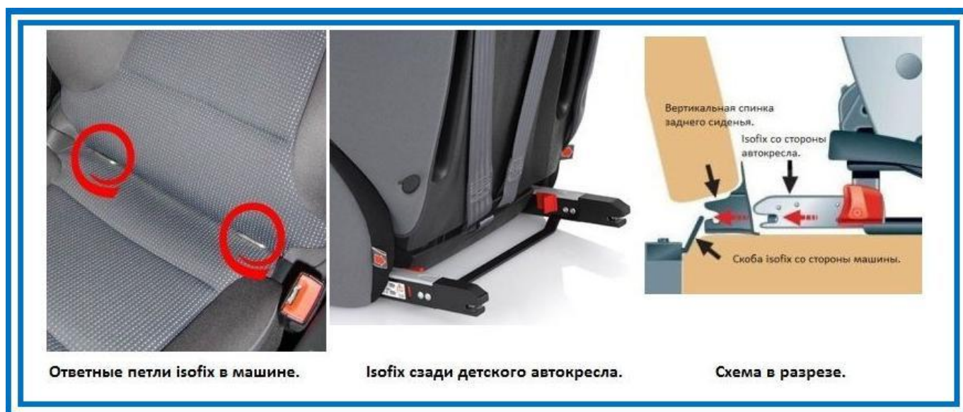
Рисунок 5. Крепления ISOFIX

Система крепления ISOFIX дает возможность быстрого и надежного крепления. За счет быстрозажимных устройств кресло надежно фиксируется и также легко снимается. Не приходится лишний раз беспокоить ребенка.