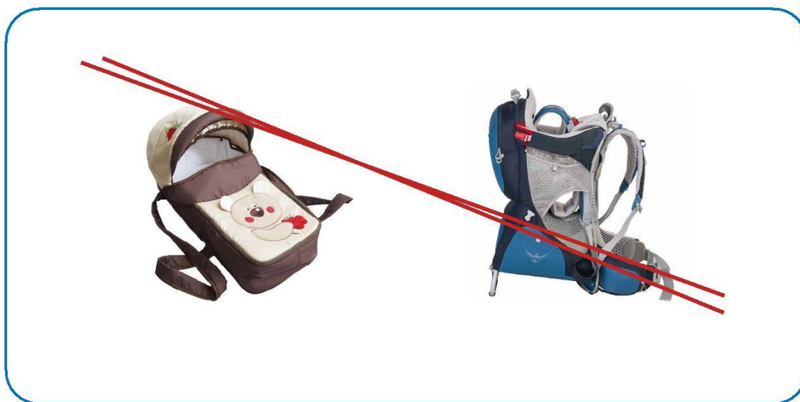
Рисунок 3. Внешний вид люльки-переноски

Люлька-переноска не предназначена для автомобиля